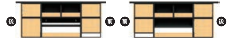
右側ユニット配置